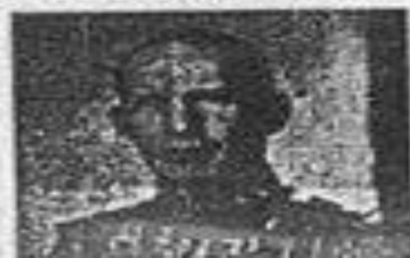
Ὁ βασιλεὺς ἐπὶ τῆς ἀποταξίας τῆς Τήνου

Τὸ ἔθνος σύσσωμον ἀντιμετωπίζει τὴν θρασὺδειλον πρόκλησιν τῶν Ἰταλῶν